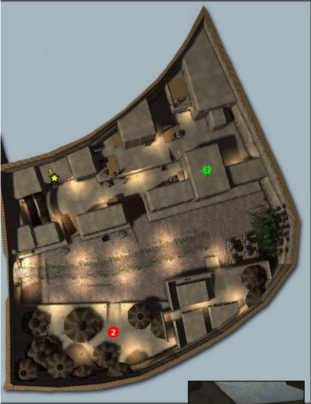
Seconde Carte (le village)