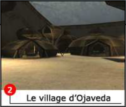
Le village d'Ojaveda